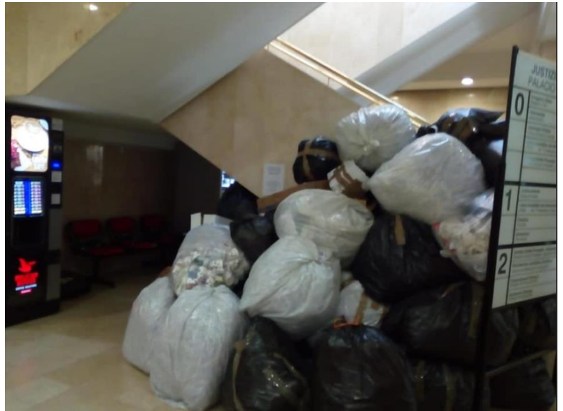
Juzgados de Bergara (16 de marzo)