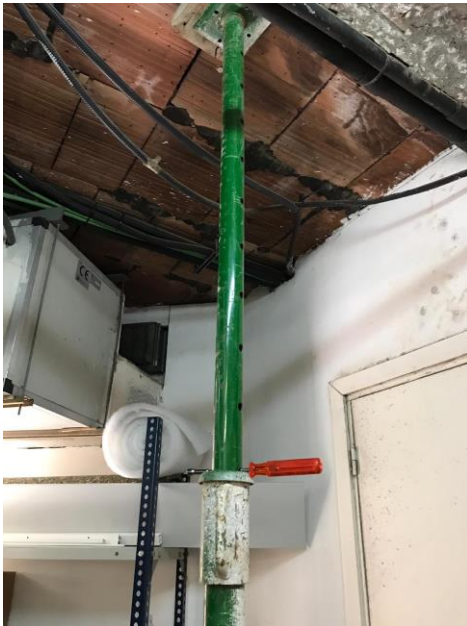
Juzgados Mixto 5 de Martorell (hoy)